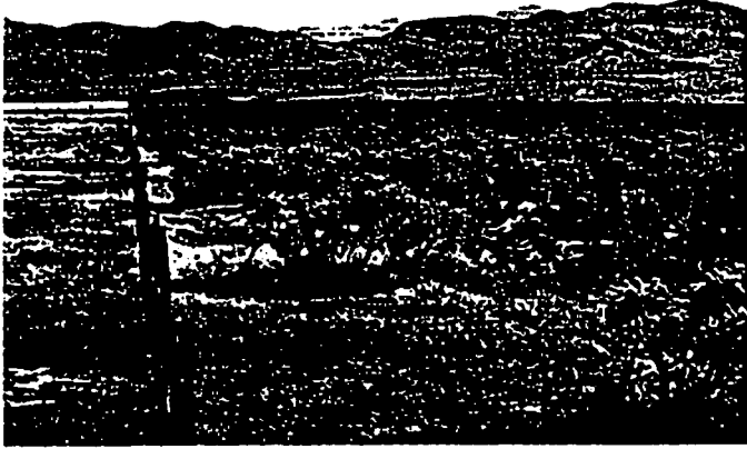
A dense walkingstick cholla stand (right) and a cabled plus raked area left in Chihuahua, Mexico.

Una comunidad con altas densidades de cholla (derecha) y una area cableada y amontonada (izquierda) en Chihuahua, Mexico.